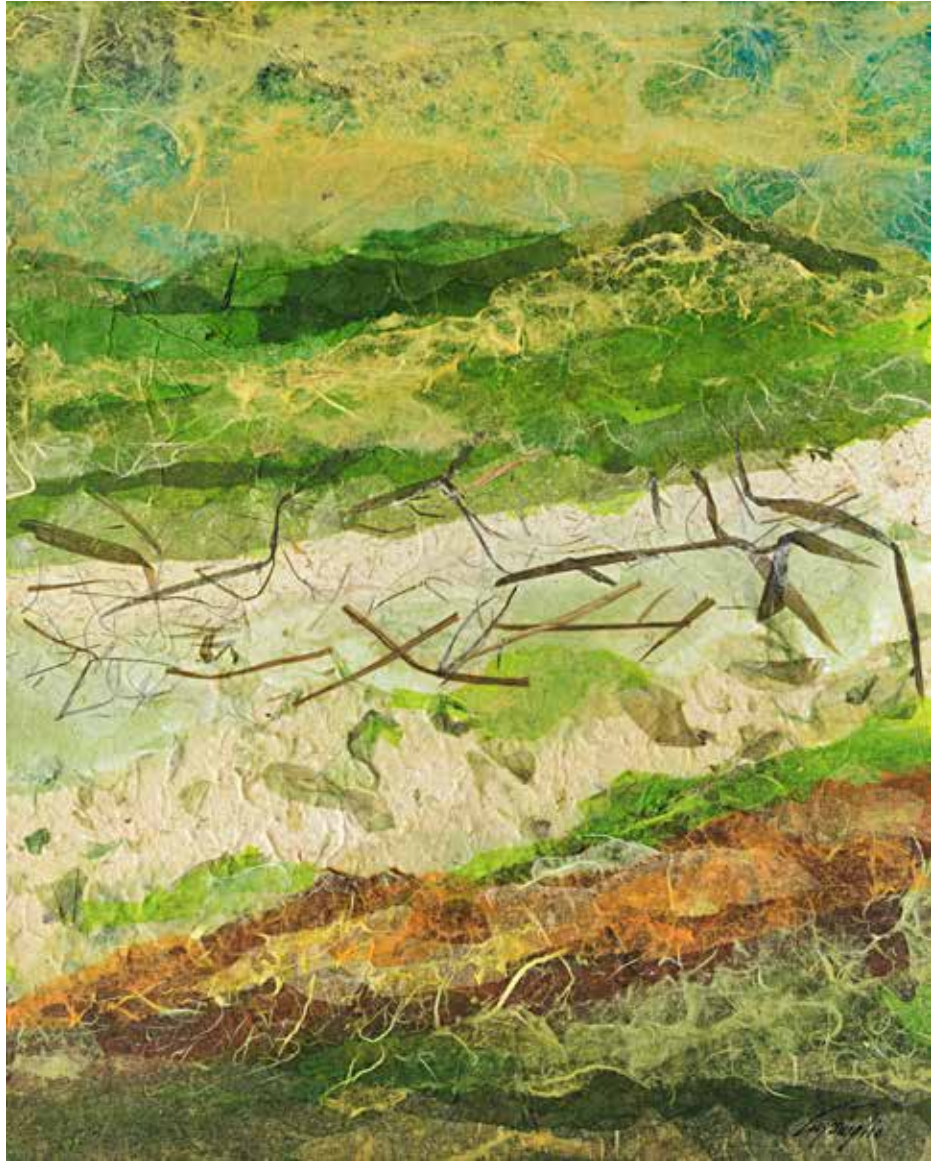
Rosignano oggi - Paesaggio verde Tecnica mista su tela - cm 40x50