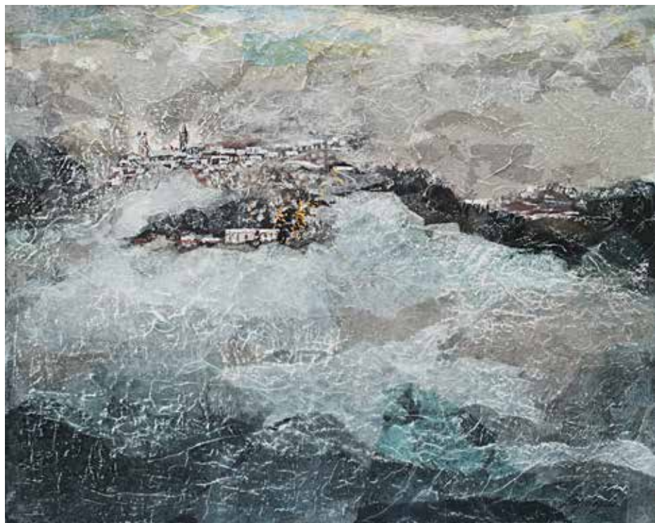
Rosignano d'inverno Tecnica mista su tela - cm 50x40