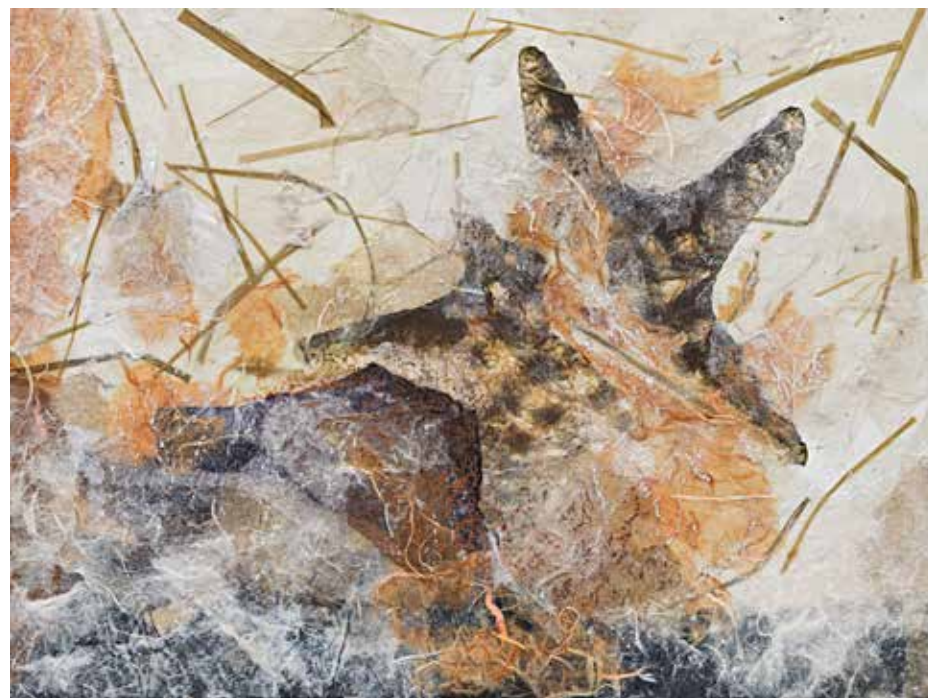
Conchiglie Tecnica mista su tela - cm 40x30