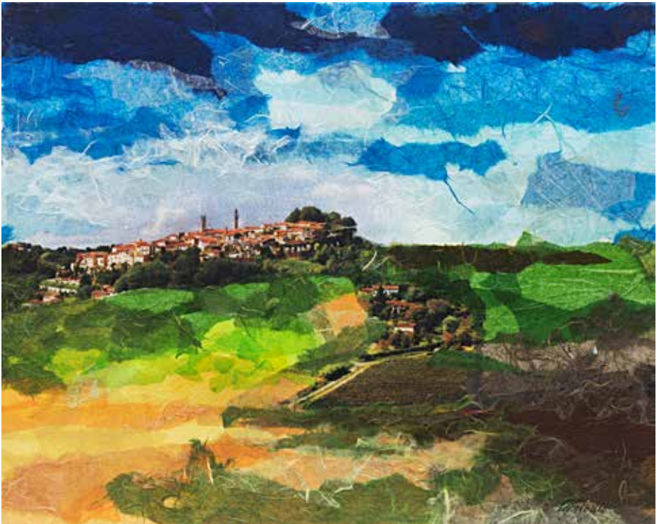
Rosignano in estate Tecnica mista su tela - cm 40x50