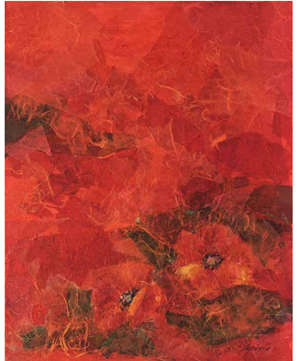
Papaveri Tecnica mista su tela - cm 40x50