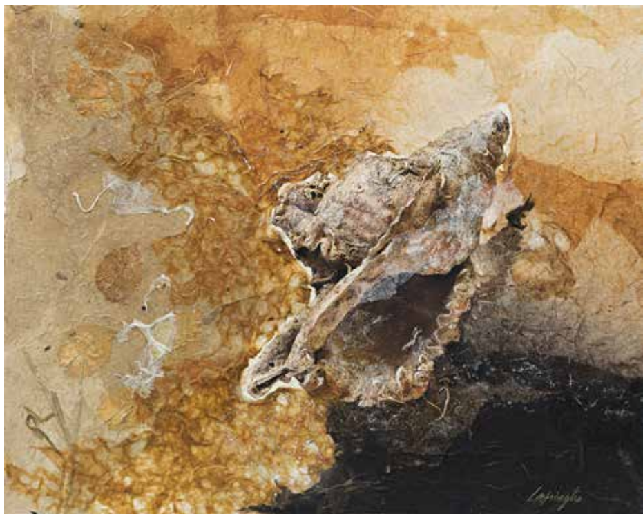
Conchiglie Tecnica mista su tela - cm 50x40