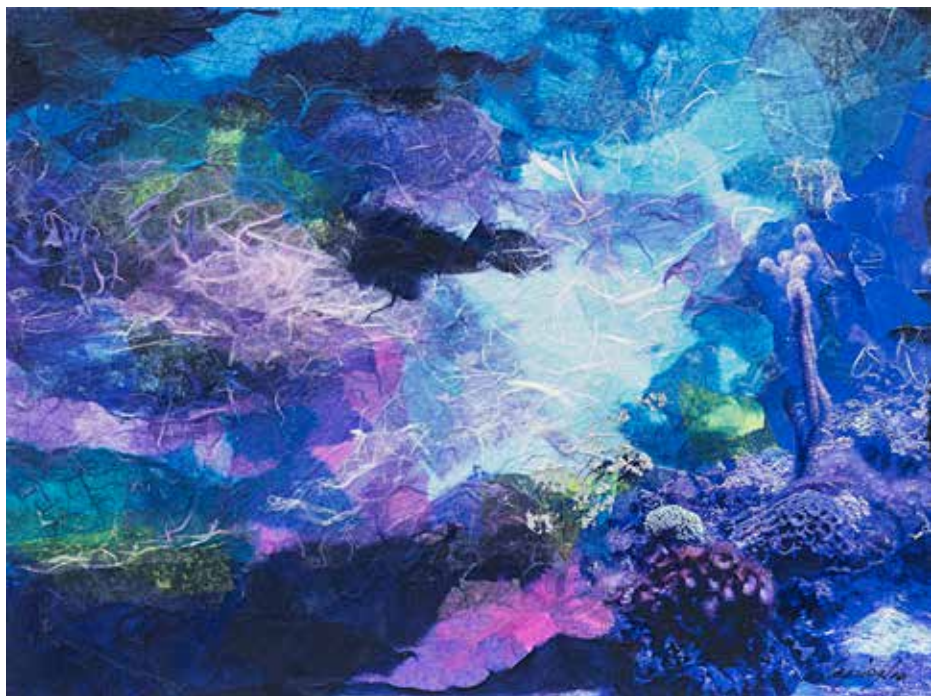
Mare profondo Tecnica mista su tela - cm 40x30