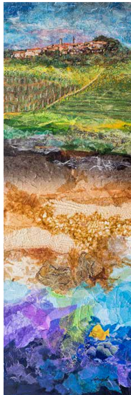
Viaggio nel tempo Tecnica mista su tela - cm 40x120

A fianco tela originaria riprodotta in fotografia su lastra di vetro per la realizzazione della stele (cm 80x240)