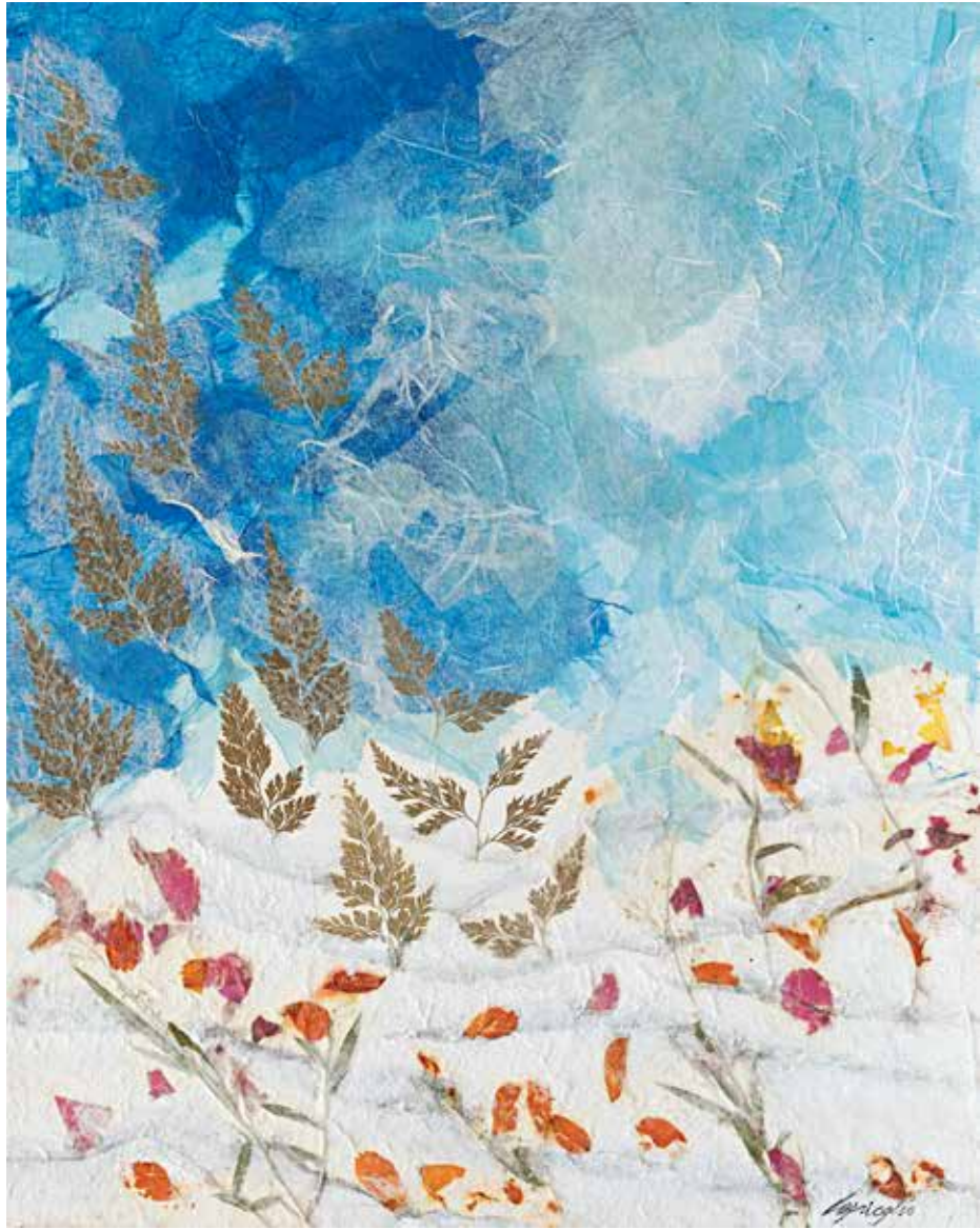
Felci Tecnica mista su tela - cm 40x50