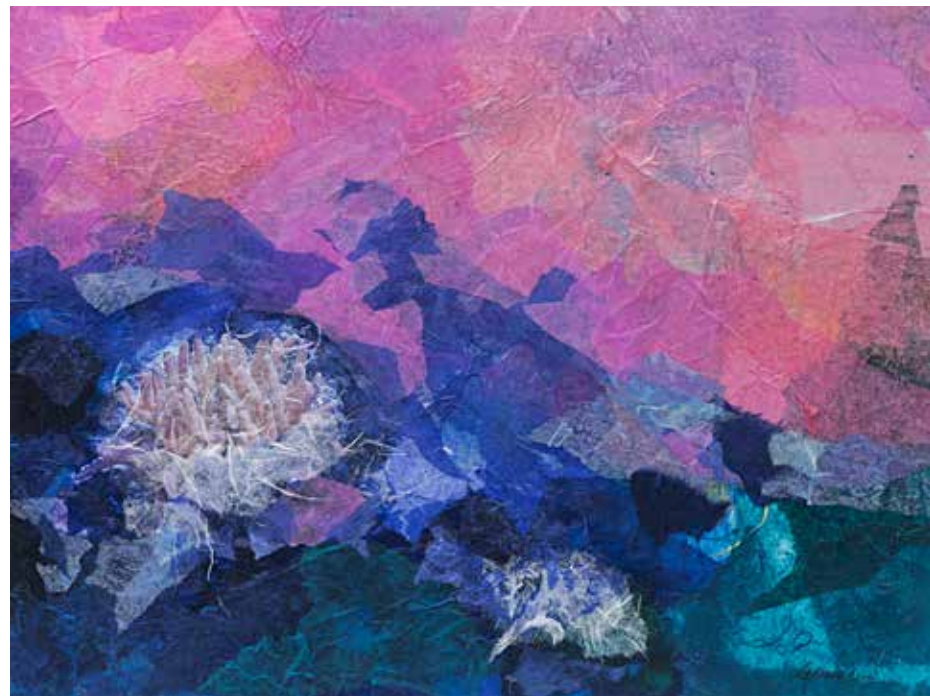
Mare profondo Tecnica mista su tela - cm 50x40