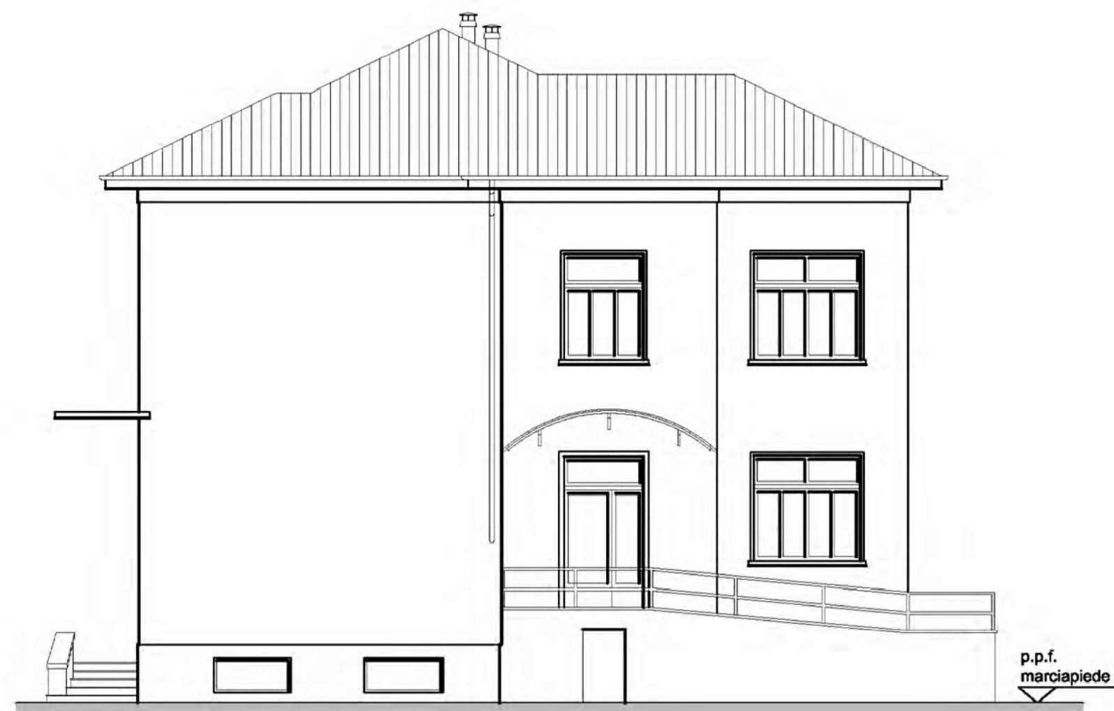
prospetto Est scala 1:100