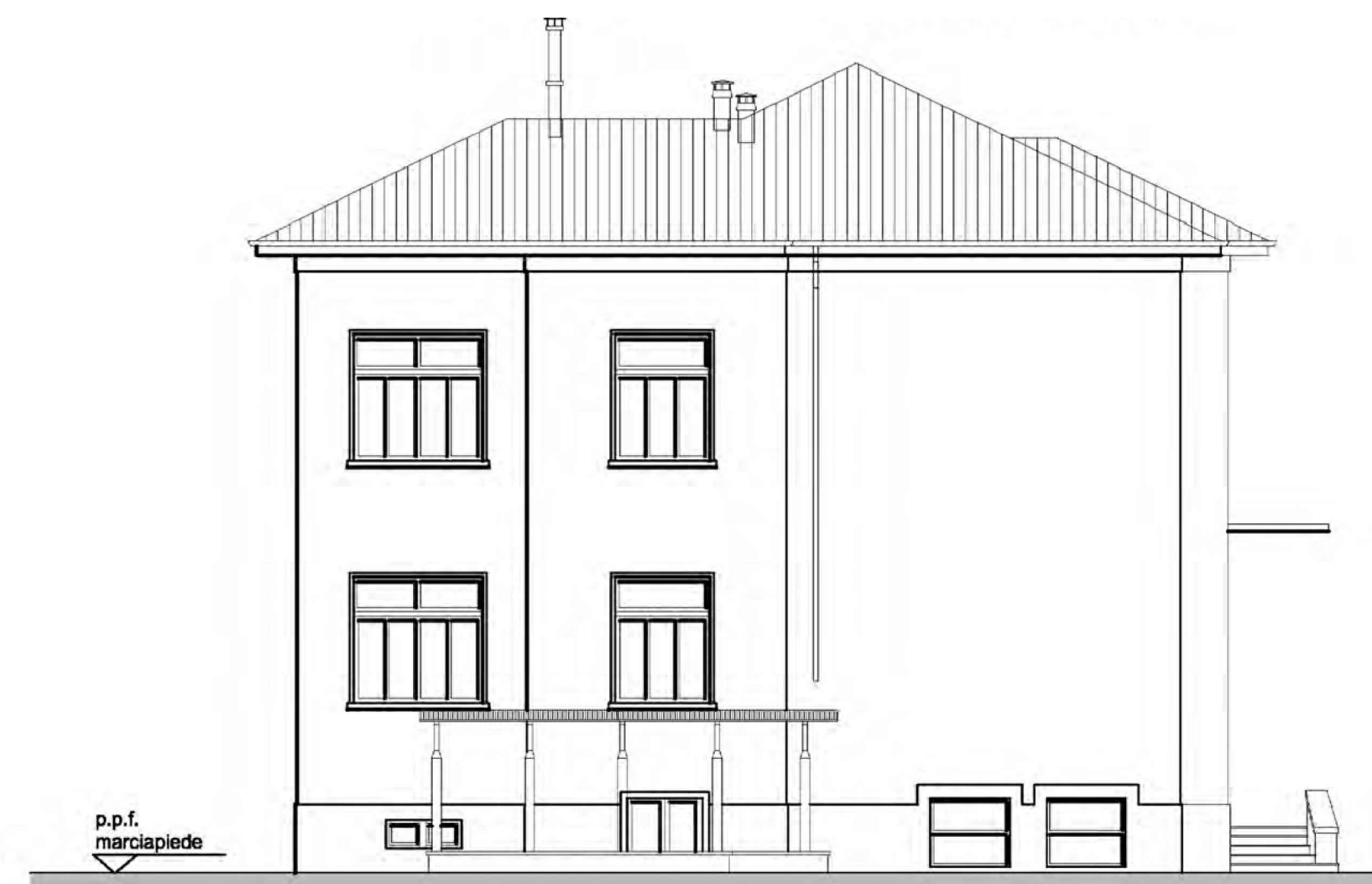
prospetto Ovest scala 1:100